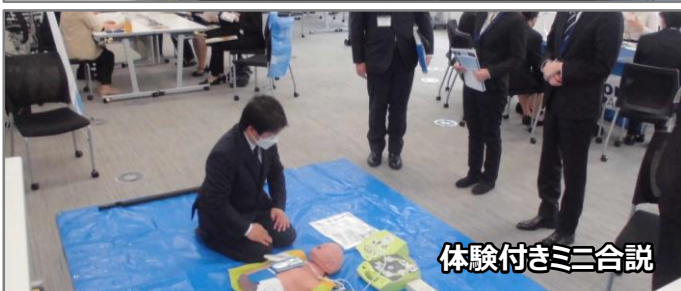
体験付きミニ合説